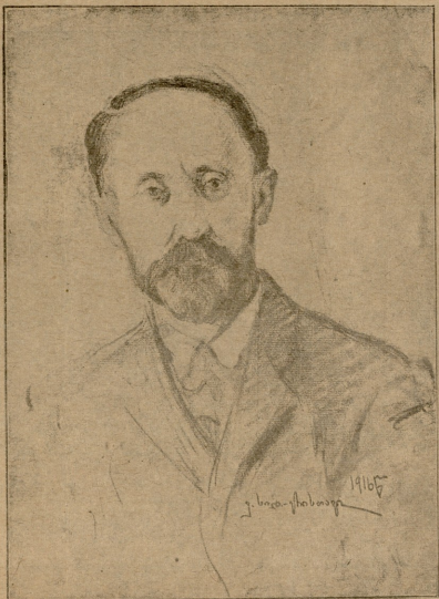
შ ი ო