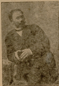
შ ი ო.