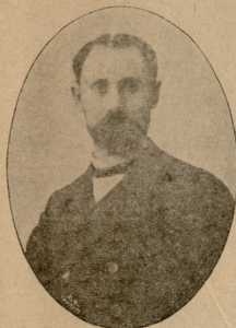
შ ი ო.