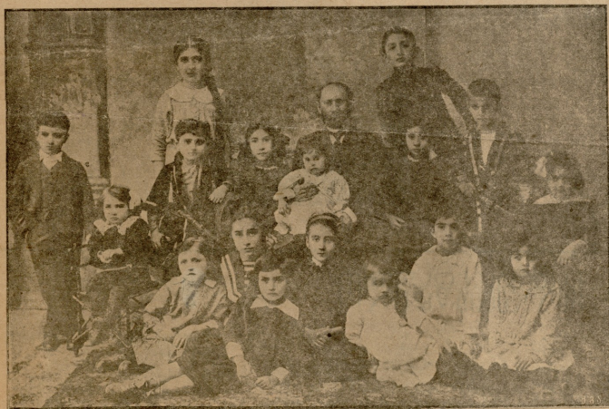
შ ი ო ბავშვებში.