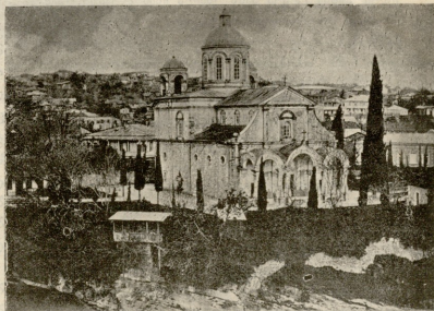
ქუთაისის რუმის კათოლიკეთა ეკლესია