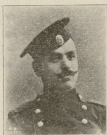
ვეკინის ღავარეს-ქე შიჭაძე. (ჯარისკაცი) შ ი ე ჯ უ ღ ი ა .

მძიმეო ღაცრა გერმანიას სსზღვარზე ნოკუმერში. კაღადგვლა ვიღის რკანის გზის სსავთშოფოთა 22 ნოკუმერს.