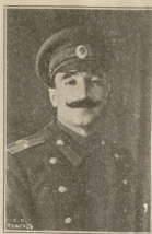
ბ. ბ. ბ. ბ. ბ. ბ. ბ. ბ.