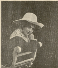
მარო მღვიმის ასული.

ახალი როდის შესრულების გამო „დახორუღ ზარმა“ 25 მარტს.