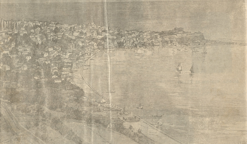
თსაზღვის ქალაქი ტრაქეზისი, (შავი ზღვის პირით) რომლის აღეთასაც რუსის ვარა სტადიათს.