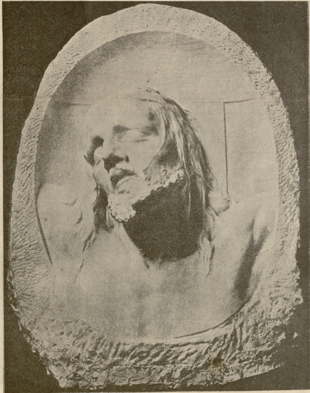
იესო ქრისტე. — ქანდაკება ანტაკოლსკისა.

ერთ დღეს სოფელში ამავე მოვიდა, რომ მეომარნი შინისკენ ბრუნდებინაო. დედის სიხარული გამოუთქმელი იყო; იმ დღეს იმაზე ბედნიერი არავინ იყო! დედაც კმა თავისი ქოხი მილაგ-მილაგა, — დღე იმას ყვი-