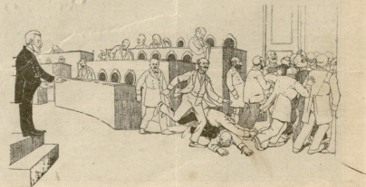
— საღ მიტქარებით ვჯერ ზომ ათი საათია მოითმინეთო ..

რედაქტორი ა. ჭყონია გამომცემელი ა. ჭახაბაძე