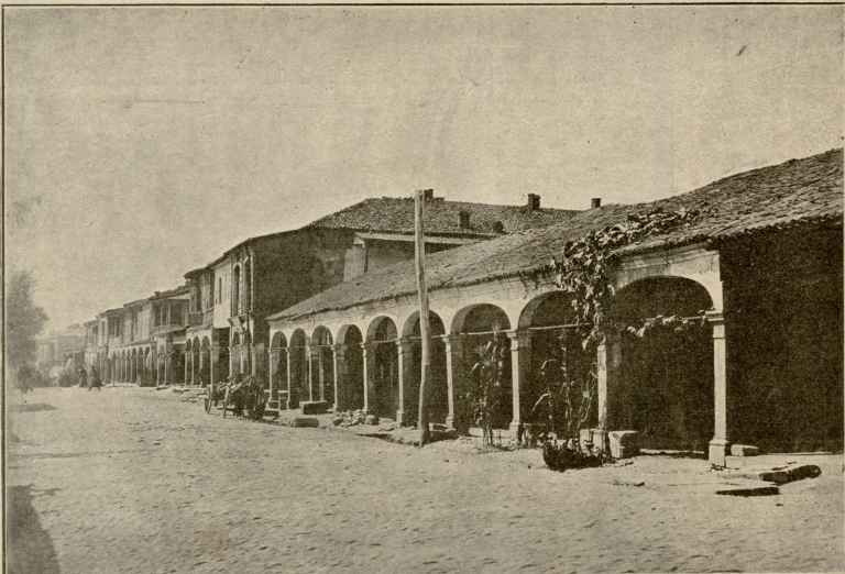
გარანგაკას ქუჩა, ქუთაისში.

აქ ყველა მისი მებობლები იყვნენ. — ჩემი იომა სადღა არის,—მიაძახა მოხუცმა დედამ მიხალმების წინაღვე.