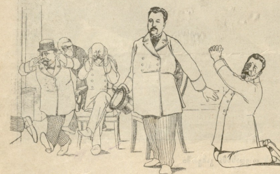
— თვალ-კრემლიანი გემუდარებეთ, გემეწეებით — მომბანდეთ საბუქოს კრებაზედ ..

თუმცა ტფილისის გამგეობის დადგინებას თანამად გამგეობის კასნოში ფული არ იწახება, მაგრამ დროთაღმა გამგეობამ მაინც ზოუები მიიღო ცარიელი კასნის დასაცავად..