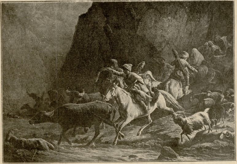
წასსული დროიდან. — ლეკების თვალსაზრისში

ერთი ბებერი კატა საღამოზედ კარებ წინ იჯდა, ნახვარად თვალები დაეხუჭა და ღრუტუნებდა. თვალი მოჰკრა ორმა თავებმა და მეტად გაიოცეს, რომ მათი დაუძინებელი და