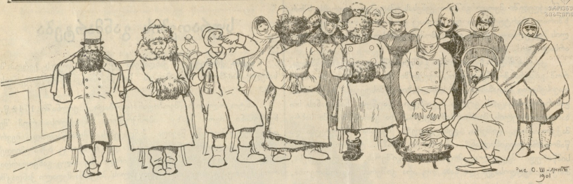
რე. ი. შ. - 1901