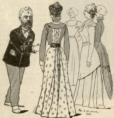
რე. ი. შ. - 1901