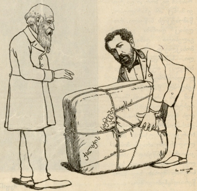
ვერა, ვერ დასძრამ, ჩემო მზო, მაგ ტერის.

ყველა მწევე და ყველა მღაჟას, ხან ერთს ვერდი, ხან მეორეს... სხვა დიდება რას მივიან, თუ თქვენს თავს არ მომავორეს.