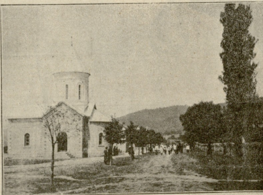
მკვლესი წინამძღვრანთი კრასის სკოლასა.

ერთს ზაფხულზე ხარი ურავის მთაზე გეუშვა საბალახოდ. იქ გიშვრას მლაშე მიწა ექნა ბეგრი, და ქიმეში ვამოსცხობოდა. ერთი თვის შემდეგ, როდესაც მორაკეს ჯგოვი, კაცამ რაღაც სისუტე და თავის ქიკინი შეაჰწინა გიშვრასა. „ეს ხარი რაღაც კარვად ვერ არის“, — შესიგელა ცოლშვილს კაცია და მართალიც გამოდგა. მლაშე მიწა თანდათან მაგრდებოდა ქიმეში და რადგანაც მონეტლები შეუტლებელი შექნა,