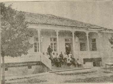
სკოლა წინამძღვრანთი კრასის.