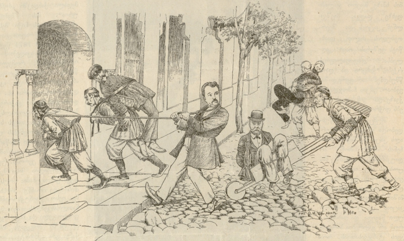
რე. ი. შ. - 1901