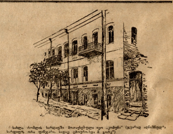
სახლი რომლის სახეშიც მოთავსებული იყო „კომუნა“

„Бродяга Максимыч пришел пешком в Тифлис, чтобы родители зябле генеральным пиджактом...“