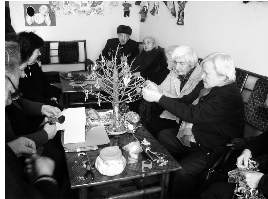
(დასასრული მე-7 გვერდზე)

და კიდევ მრავალი სხვა. შემდეგი პროგრამაა „კვების პროგრამა“, თუმცა დღესდღეობით ჩვენ კვება სასადილოში აღარ გვაქვს, რადგან აღარაა ამის მოთხოვნილება. ჩვენი ორგანიზაციის წევრს, რომელიც მოგვმართავს და გვეუბნება რომ აქვს მატერიალური პრობლემა და სჭირდება პროდუქტებით დახმარება, ეძლევა „პროკრედიტ ბანკის“ საბანკო ბარათი და ამ ბარათზე ყოველთვიურად ვურიცხავთ გარკვეულ თანხას, კატეგორიების მიხედვით. ჩვენ გვაქვს