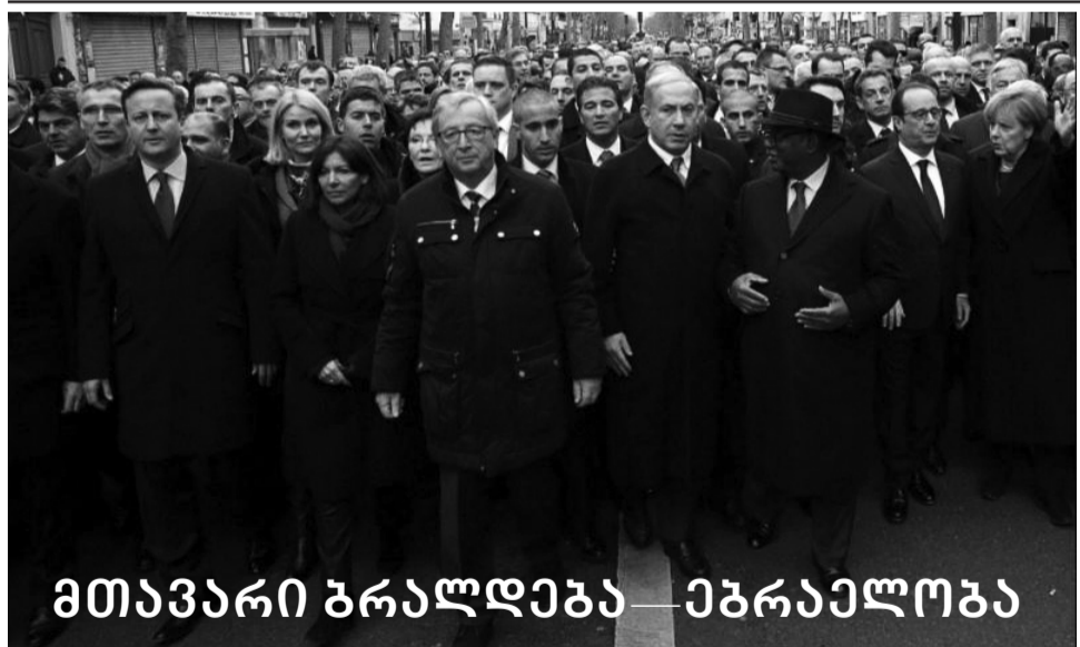
მთავარი პრალდება — ებრაელობა

ლეონიდ ხოროშევსკი: ეს არარსებული ერის გამოგზავნილი იმასაც კი ბედავს, თავისი აყროლებული ბანდიტური პირი გააღოს და ისრაელს დაემუქროს?! სუკ-ის ნაბუშარი ვერასოდეს ვერ გახდება ხალხი და ვერავითარ სახელმწიფოს ეგენი ვერ შექმნიან.