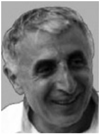
(დასაწყისი იხ. „მ“ №6)