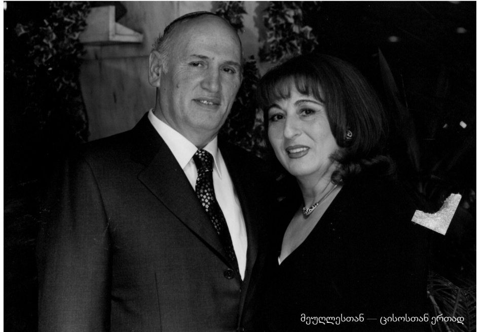
მეუღლესთან — ცისოსთან ერთად

აგისრულდა სანუკვარი ოცნება, ალბერტ! 1972 წელს ოჯახითურთ განახლებული აღიის ძლიერ ტალღასთან ერთად წმინდა მიწაზე ახვედი!