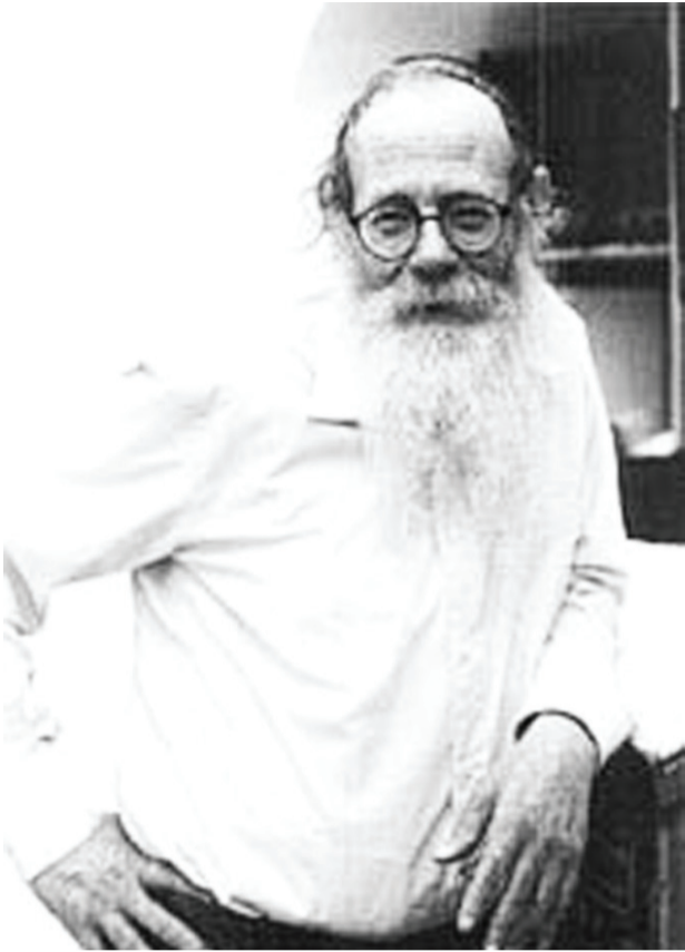
დასაწყისი იხ. „მ“ №18