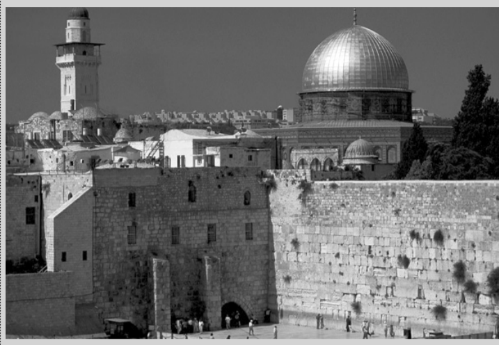
სამაგიეროდ, ქალაქის ხელისუფლება არაბულ სექტორს არ უწევდა საბაზო სოციალურ მომსახურებას.

მაგრამ ამ ანეგდოტს არა აქვს შესაფერისი დასასრული. უბრალოდ, სამივე ამთავანი აცხადებს, რომ სწორედ მას ძალუძს იერუსალიმის ყოველი სენის.