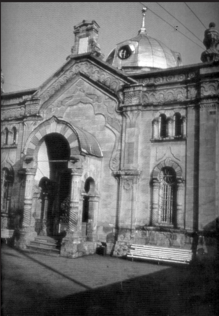
ონის 114 წლის ბაიტი ქანსეთი