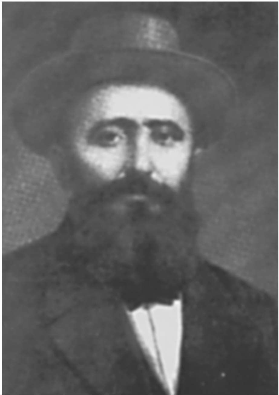
ცნობილი საზოგადო მოღვაწე იაკობ სეფიაშვილი