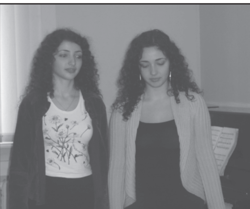
შეუწყობს ამ ორი ერის მეგობრობის განმტკიცებას, ებრაული თემისადმი პატივისცემას და მომავალი თაობებისთვის ძველი ტრადიციების გადაცემას.

დისკუსიაში გამომსვლელებმა აღნიშნეს, რომ ასეთი ღონისძიებები ხელს