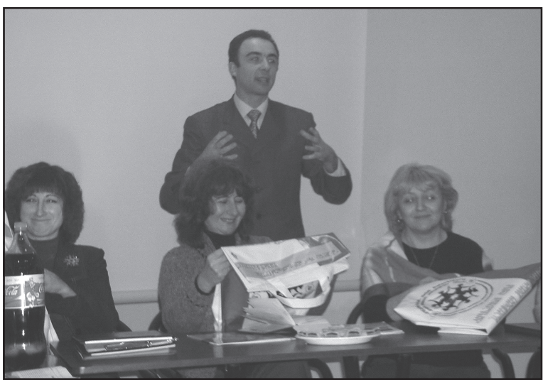
მშრომლოთ. ჩვენს ორგანიზაციას უამრავი პროგრამა აქვს, ვფიქრობ, ყველა ორგანიზაცია აირჩევს მისთვის სასურველ და საინტერესო პროგრამას გაუზიარებთ ერთმანეთს ცოდნასა და გამოცდილებას და საქართველო შუა იმ ქვეყნების საიმი, ვისთანაც „კე-

– მობრძანებული ვარ, რომ გზედათ ამდენ ღამეს ქალბატონს და თქვენი საქმიანობიდან გამოდინარე ვერსუნიდები, რომ საქართველოში ქალს ნამდვილად ღირსეული ადგილი უჭირავს. ჩვენი ორგანიზაცია ასწავლის ქალებს პროფესიონალურად იმუშაონ სხვადასხვა ჯგუფებთან, რათა საზოგადოებას და ოჯახში თავი კომფორტულად იგრძნონ. საქართველო ორგანიზაციებით და მიღწევებით მდიდარია. ჩვენი სურვილია ეს აქცია არ იყოს ერთჯერადი და წლების მანძილზე ვითანა-