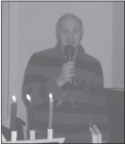
ფერ თორის შებრძანების დღესასწაული.

კლუბის სპეციალური სტუმარი გახლდათ საქართველოს მწერალთა კავშირის უცხოეთთან ურთიერთობის განყოფილების გამგე, რუსეთის ფედერაციის მწერალთა კავშირის სარევიზიო კომისიის წევრი, რესპუბლიკის დამსახურებული