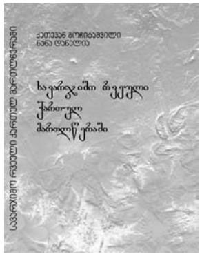
სავარჯიშო რვეული ქართულ მართლწერაში

ნიმნი I კველი ქართული მწერლობა; ნიმნი II „ვეფხისტყაოსანი“; ნიმნი III XIX საუკუნის მწერლობა ნიმნი IV XX საუკუნის მწერლობა