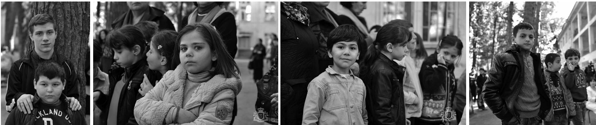
რიჩარდ ნორლანდი: ამერიკის

შეერთებული შტატების ევროპის სარდლობას მსგავსი სამოქალაქო დახმარების პროექტებისთვის გამოყოფილი აქვს გარკვეული თანხა. ამერიკის შეერთებული შტატების არმიის ინჟინერთა კორპუსი ხელმძღვანელობდა ამ სკოლაში მიმდინარე სარეაბილიტაციო სამუშაოებს, რითაც გაუმჯობესდა პირობები სმენადაქვეითებული მოსწავლეებისათვის. დამონტაჟდა ციმციმები, რომლებიც მათ გაკვეთილის დაწყებას ან დასრულებას აცხობენ, ასევე, საჭიროების შემთხვევაში, ხელს შეუწყობს ევაკუაციის პროცესს. ჩვენ მხარს ვუჭერთ ინკლუზიურ განათლებას და მივიჩნევთ, რომ შეზღუდული უნარების მქონე მოსწავლეები და სტუდენტები სრულად უნდა იყვნენ ჩართული სასწავლო პროცესში.