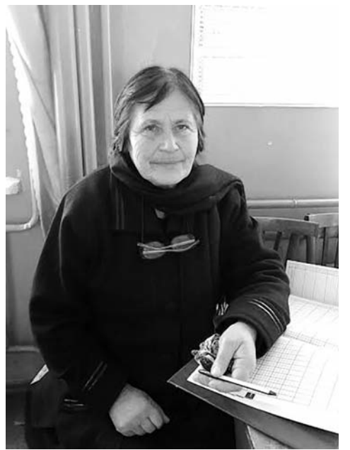
ვრწმუნდები, რომ სწორი არჩევანი გამიკეთებია. მადლობა ყველას, ვინც დაინახა და დააფასა ჩემი შრომა“.

დასასრულ ღვაწლმოსილმა პედაგოგმა ითხოვა სიტყვა: „ყოველთვის მსურდა, მასწავლებელი ვყოფილიყავი და ამ გადასახედიდან, დღევანდელი საღამოს შემხედვარე,