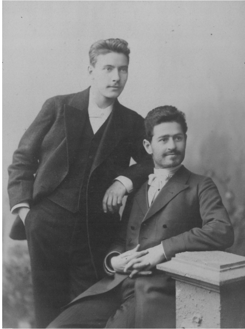
98. ორი უცნობი მამაკაცი. 10 x 16.