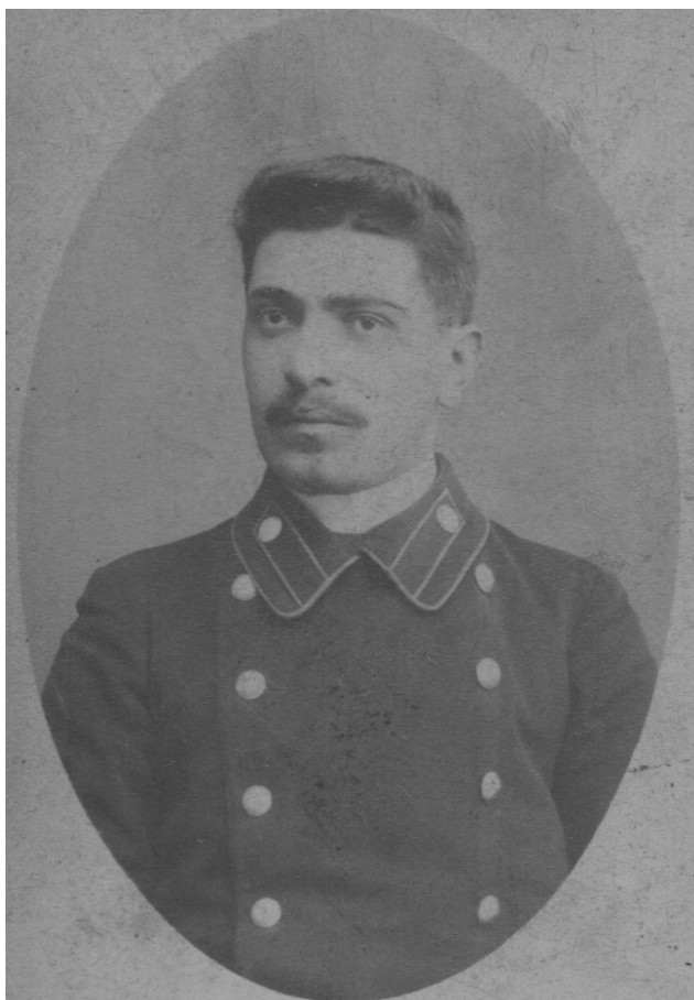
103. უცნობი მამაკაცი. თარიღი მითითებული არ არის. 6 x 10.