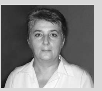
რუბრიკას უძღვება მამა თამაზიშვილი

მიუახლოვდა იაკობი თავის სამშობლოს, დაბანაკდა ერთ მინდორზე და დაიწყო მზადება მმასთან შესახვედრად. მის გულში ძმის, ესავის შიში ჩაბუდებულიყო. მაშინ ღმერთმა გაამხნევა ის და იაკობს ანგელოზთა კრებული გამოეცხადა. იაკობმა დაინახა და თქვა: ეს ღვთის ბანაკია, და უნდა სახელად ამ ადგილს მახანაიმი.