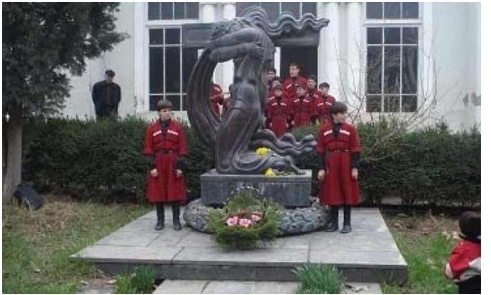
ქორეოგრაფიული ანსამბლის „შირაქი“ წევრები 9 აპრილის მემორიალთან

ქართული ხალხური შემოქმედება ჩვენი ეროვნულობის ერთ-ერთი ნიშანია. ამიტომაც ენიჭება დიდი მნიშვნელობა ქართული ცეკვისა თუ სიმღერის ანსამბლების არსებობას, რომელთაც თაობიდან თაობას უნდა გადასცენ ცოცხალი განძი, რომელსაც ფოლკლორი ჰქვია.