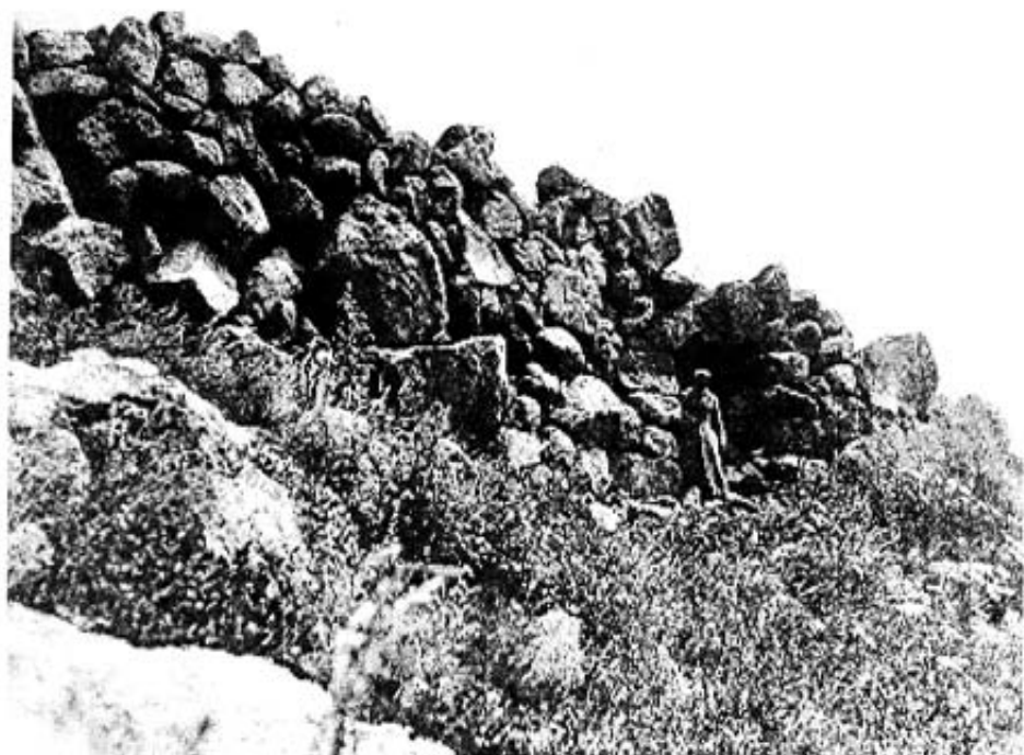
11. ურბნის ციხის კედელი