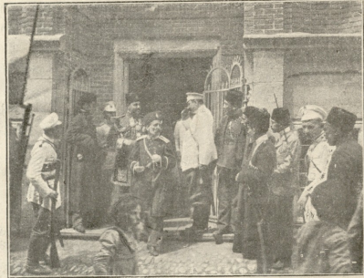
საზარსეთის კონსტიტუციის მეჭვილიდან გამოქვლი.