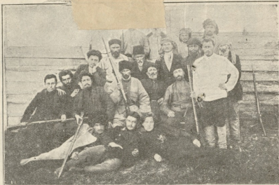
ტობოლის გუბერნიის გადასახლებულ პარტევლთა ერთი ჯგუფი. (იხილეთ „ზარიმა“ № 103)

შეტრე (ეგვლე ხელგებს და ავკრფავს) მე გეუბნარებით,