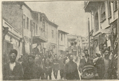
საზარსეთის მეჭვილიდან მიღს, სდაქ სამალაბოლი პარაკლისი გადისხდს.

თქვენი ქალი უნდა მომთხოვოთ ცოლად. ვარწმუნებთ, თამარ ჩემთან ბედნიერი იქნება!