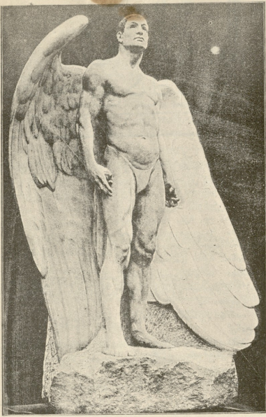
ლუციფერი. — ახალი ქანდაკება რეზბერგისა.

ნანა. თუ იცი, რომ ინსტიტუტში ანაბანაზედ მეტს არაფერს გეაწვდიან, მაშ რაღად მიმბარე?