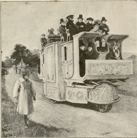
ავტომობილი, გავეთებული ინგლისში 1882 წელს.

ხმით, თითქოს თყვის თაყვას ესუფერება, როდესაც იმხვე ვეცეკობ, ჩემი ქმარი რაღაცა პატარა, უზნებუნებელი კაცად მჩვენებდა. არ მინდა იმხვე ფიქრი, მაგრამ ჩემდა უნებურად იმისი სახე, მისი არწივისებური ამაყი და ჩათვირებული თვალები სულ თვალწინ მიდგას.