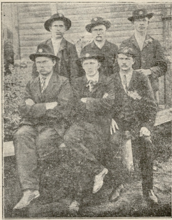
ავტონომიური ფინლიანდია.—ფინლიანდის წითელი გვარდია.

გავიდა ერთი კვირა. ცხოვრება ჯერ ჩვეულებრივს კალაპოტში არ ჩამდგარყო; სწავლა ჯერ არ დიდყოფო. ერთს დღოს ისე ძლიერ ასტყვიდა მუცელი კაპიტანს, რომ ექიმიც კი მოაკვანინა. ექიმმა ლხბარა, ქათმის წვეწის მეტი არაფერი გუქმებო.