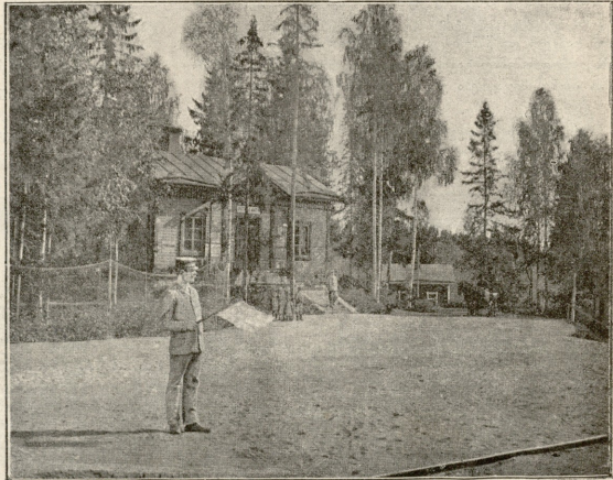
ავტონომიური ფინლიანდია.—ფინლიანდის რკინის გზის სადგური. ფინლიანდიაში წმირად სადგურები უღაბურ ტყეებშია, განაბრტყავით, ასეწომ სადგურის უფროსის მეტს თითქმის ვერავის ხელდას კაცი. მაგრამ არც მარცხვას არც ქუთლბას იც ადვილი არა აქვს. ეს სადგურები ფინლიანდიაში ცივილიზაციის და კულტურის გავრცელებს თვლიდა.

ასევე ამაოდ ჩაურა თხოვნა კიდევ ორსამს ადგლის