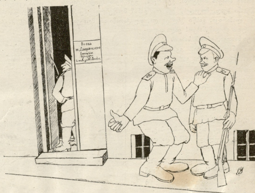
— სტინარია ზომ გავათავი, აშანავო, ეხლა გინმხაზში გადმოგიყვანეს.

იმდენს იზამს ქალი, რომ მამას დოიყოლებს და მსახური თითონ გააბარებს ანარქისტს.