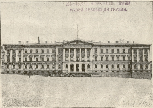
ავტონომიური ფინლიანდია. — სენატი, აშენებულია 1822 წ. სენატის მოედნზე, ჭელხინფორსში.

ქათამი კაპიტანს ორს ღდეს ეყო, მოსამე ღდეს კი, იმდენად მოკეთდა, რომ დაკვილი ხორცი სქამა. სახლიდან არ გასულა იმ ღდეს, სალამოზედ სამუშაო ოთახში იჯდა. ამ ღდოს საშინელი ხმაურობა და აურზაური მოესმა სამხარეულოდან. საჩუქრად ვახარდა და შემდეგი სურათი დაჰვედა. ძალზედ გაბრაზებული მებერი დედაკაცი, ადგილობრივ დიუკენის ცოლი, იწვედა თომასკენ, ის კი, შეშინებული და შერცხვენილი უკან-უკან იხვედა, ქოჩორა და დაუპატიებელს სტუქარს იგერებდა.