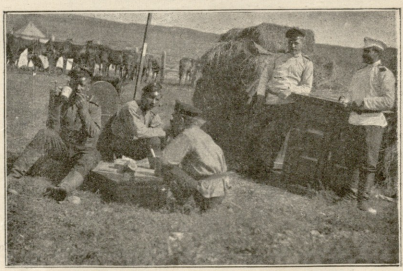
მეთრამეტ ბატარის არტილერისტნი, რომელნიც კავკაში ბაჯანდნენ. აჯანყებულნი ყარსში გაგზავნენ.

თომას ვიწრო შუბლი მოველუმა და უფრო დაუვიწროვდა... რამდენი ტანდავება გამოიარა ამ რამდენისამე ჩნის წინად იმის წყალობით, რომ ერთს მიყრუებულ სოფელში სცხოვრობდა და ანაფერი იცოდა, მასთან, რააკიკრეულია, არც სამხედრო ბევრას წეს-რიგი... იგი დედმამის ერთადერთი შვილი იყო და დაწმუნებული იყო ისიც და იმის მშობლებიც, რომ ჯარში არ გაიწვევდნენ. არც წაიყვანდნენ, კანონის ძალით, დედმამის სიბოძლებით რომ შეეროთ ცოლი, მაგრამ თომა ჯერ ოცის წლასა არც კი იყო, როცა მშობლები დახუცა, და, როდესაც ქონების ერთადერთი მემკვიდრე გახდა, დაუწინაღობე შეირთა ცოლი, რადგან სხვის დაუხმარებლად ვერ შესძლო გასძლიოდა საქმეს შინაც და გარეთაც... ფიქრადაც არ მოსულია, რომ ჯარში გაიწვევდნენ, რადგან მარტაბელი იყო. დარწმუნებული იყო, რომ ნება არ ჰქონდათ, დაემორბინათ ცოლს და შვილს, რომენიც ისეც უნდა გამოეცხება, როგორც მოხუცებული მშობლები, და მამულს, რომელიც უნდა შეეჭმუნებინა, რომ ოჯახში შენახა და სხვა და სხვა ხარკი და გადასახადი მოეზარებინა. მაგრამ გაიწვევს ჯარში, გვიანჯეს, გამოსადეგად სცნეს და წაიყვანეს... რამდენმა ცნად და ფულის ხარჯვამ ჩაუთრა ამაღ ამ უსწავლელს, გაუნათლებელ კაცს, როდესაც ქალღმრთის აძლევდა და სიტყვიერ თხოვნიდაც