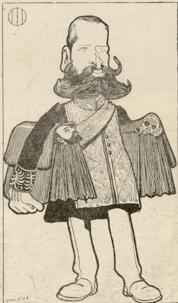
— მე ორი პორტული მაქვს. ამისთანა პორტულებით, იმედი მაქვს, გაუფლვი საქმეს...