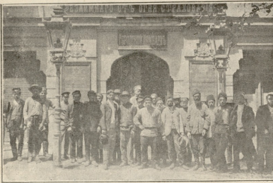
ტფილისი.—უსკამად დარჩენილი კალაქის საბჭოს წინ.