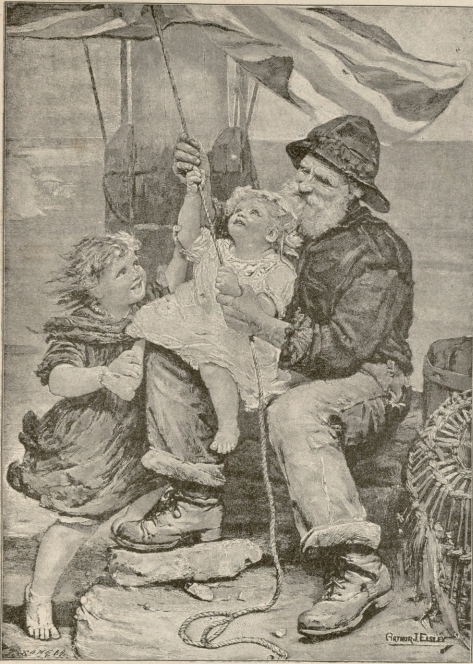
მატარა პატრიოტები.—სურათი ელსლევისა.