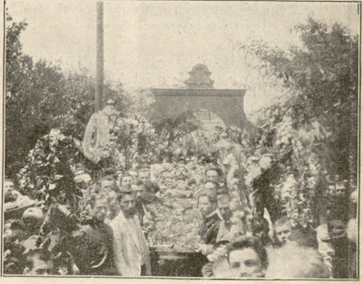
შოა ჩიტაძის დასახლება. პროცესია ელესიის წინ.

— მეყოფა... საწყაო ამეგსო! — მოკლედ მოუტყრა სიტყვა გრიგოლმა.