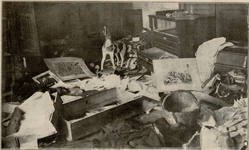
სამუშაო ოთახი. — საკუთარი დირექტორი.

— მზუნჯობდა. თითქოს მღელვარე წყალი გადაეცესო, გულ მათუთქული დადიოდა. ქუჩაში მიმავალ საბოს მუზობლები და შტერ-მოყვარენი გამომტდლის თვლით აშტერდებოდნენ და ცბიერად ეციხებოდნენ: