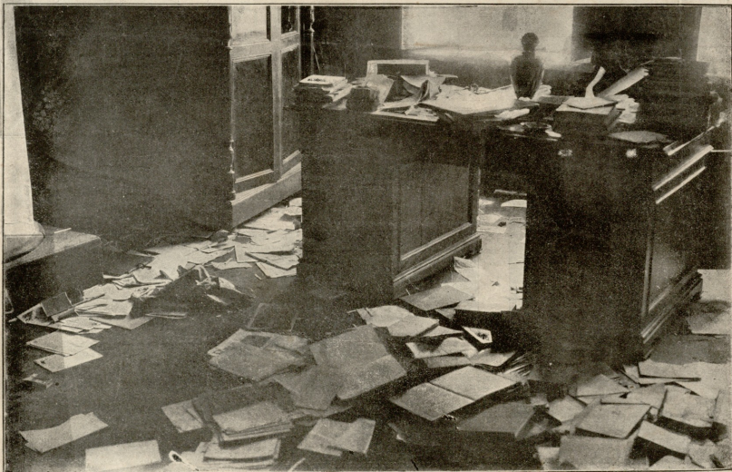
შოი ჩიტაძის კაბინეტი, აკლე ული თავდაშსმელთაგან.—საყუართი ფოტოგრაფია.

ახლად უნდა გადაკეთდეს სამგალობლო, რისთვისაც მათმა შეუწყვეტმა ექსპსის ფრანკი შესწირა. ფიჭვის ხის ძვიელი მერხულები უნდა აეშალათ და სა-