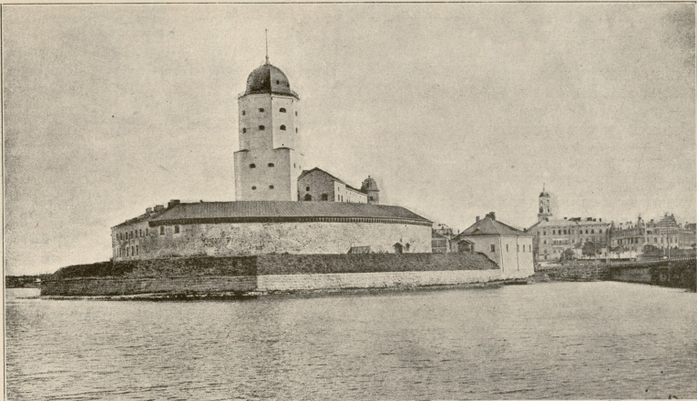
ავტონომიური ფინლიანდია. —ვიბორგის ციხე აშენებულია 1298 წ. ქუტუსიის მიერ ჯვაროსნობის ომის დროს. 1710 წლამდე ხშირად ჭკონდათ ბოლშა რეზებს და შეველებს, როგორც იცადებენ აღმოსავლეთ ფინლიანდის ხშირად დამარცხებულა აქ რუსეთის ჯარი. მაგრამ 1710 წ. პეტრე დიდმა მიაციდა აფარებელი ჯარი და დაიპყრო ეს სიმაგრე, რომელიც შეადგენდა ფინლიანდის კარის განსაღებს. ავი ამის შემდეგ რუსეთის გაუმჯობარმა მოაგრობაჲ ნელ-ნელა დაიპყრო ფინლიანდია.

რომ ამ ბატონ სულელ ფრინველზე ორი საში ყბად ასაღები ისტორია გაიმოთ.