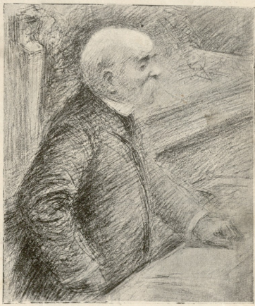
რადიკალი კლემანაო. სტრანეგონის შინაგან საქმეთა მინისტრი.

ერთ მთავარიან დამემი შევლი მოვკალი. მოვიდ ზურგზე და გახარებული წავედი შინსაცენ, რადგან შეველს ყუველ დამე ვერ მოჰკლავ. დახლოვებთ დამის სამი საათი იქნებოდა, რომ მივედი... ფენჯრიდან სრიალედ მოსწინადა. გამიკვირდა ესა. დავაჯაუნე კარებზე, რომელიც მუდამ შიგნიდან იცეკბოდა ხოლმე, როცა მე სადმე მოვიდოდი, დავარკუნე კიდევ, კარს არავინ მიღებდა. კიდევ უფრო ღონივრად დავარახუნე. მაშინ მოჰსება ჩუმი კნესა, ყვედრება, შემდეგ ფეხის ტყავატყუევი მიწის იატაკზე... და რაწახე... ჩემი ცოლი ნახებრად წიშველი, მკვდარივით გადაფთვებული, სისხლით იყო მოსყარლი! ჯერ მეგონა, მოსაკლავდ მიტკობიან მეთქი, მაგრამ ცოლმა მითხრა: ნუ ღრიალებ მაგრე, შე ახამზადე, ვერა ხედე. რომ შშობიარე ვარო? ღვთის რისხვა იყო ესა!.. თუმცა ეს ყუველ დღე მოსლოდნილა იყო. შევე, შევლი კუთხეში მივავდე და თოფი ლუქსმანზე ჩამოვიკიდე