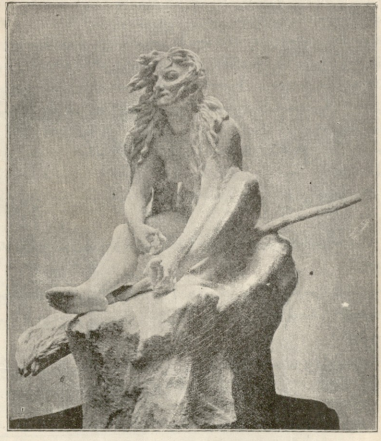
ალქ:ჯი. — თერეზა მისის ქანდაკება.

ბოლოს გამაჩნდა უკანასკნელი ურემი, ამაში იჯდა ორი დღეიკაცი და ერთი კაცი, რომელშიც ჩემს დანახვად თვა- ლები დახვუტა. სისხლი ამივარდა თავში. ეს ფთარი სურტო იყო, ხოლო იმის გვერდით მარკიზა ადელიდა და ქოფაკი ეჭარასა. ამ ეჟად კი გილოტინა სამართლიან საქქეს ასრუ- ლებდა. თვლი არ მომიშორებია მათთვის.