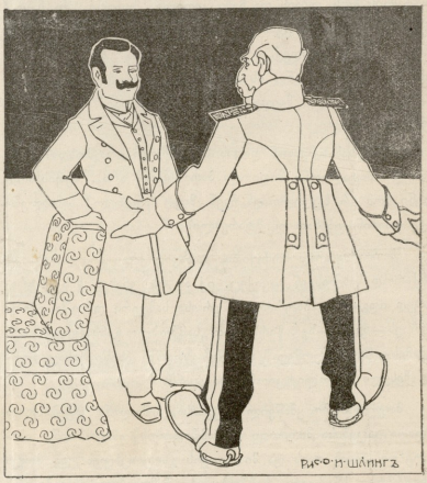
მუნდრაისანი.—მემღერებთან, რად სდენი ვაფიცვის თავისუფლებასო. ვაგონილა ამისთანა სძაფლობა? ამ ნნის ციცი ვარ და არ მახსავს რომ ქათამი მანეთად შევიღოს, ახლა კი მანეთს მართმევენ.