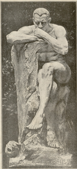
ლუციფერი.—თურეზა რიხის ქანდაკება.

— ეს ღუქანი იქნება,— შენიშნა მორგანმა:— ალბად ამ ორს მოვარაღი ამხანაგი მიჰყავი სახლში. ეს პარიზელები არაფერი შეიღებები არიან, ძალიან ჩქარა ეკიდებთა ღვირა.