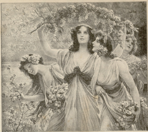
მასის დღე.—სურათი შრამის.

ლიკ მუფის ოთახში ნაპოვნი. ყოველ დაბრუნებულ ამხანაგს ცრემლით ვეგებებოდათ. გაიარა რამდენსამე ხანა, ათარავენი მოგვემატა. კაპიტანმა უბრძანა, დადი შევეყენებინათ. მერე ჩამოთვალა ყველას სხეული და გვარი. თუ რომელიმე გვარის თქვაზე ხმას არავინ გასცემდა, მაშინვე სამგლოვოვარა დაღეს დაკრავდნენ, ამ ნიშნით ყველა მიხვდებოდა, რომ ამბა და ამან თავისუფლებისთვის თავი შესწირა. ბოლოს აღმოჩნდა, რომ სულ ორისი კაცი დადგეკდა, ამათში ოცი მეკადრი და ას-ათამოცი დაკრილი. ამ ანგარიშის დროს გვარდილებს მიცალბებულების გვაგები გამოჰქონდათ. როდესაც სამატრას გვაში გამოასვენეს, სამხედრო პატივით ვეცით. ცრემლით აგვეგვო თვალები, სახეებო წესი დაღეუწეუა, ყველაში მიკ-ცვილით მეგობარს და დაეუკნეთი ნი გაყუთული ხელები, რომლითაც მარსელიდან პარიზამდე მოიტანა თავისი დროშა, რომელზედაც აღნიშნული იყო აღმართის უკვდავნი.