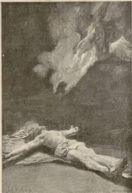
მოსიგენა. — სურათი კერტერ-ნისა

ბატანივით გაცევი და თან უკან ვიხედებოდი, სურტო ხომ არ დაბრუნდა მეთუი. ჩქარა მივედი მეფის კართან. მარსელელებს დღე დაფეს ხმა ისმოდა. გარჩე სისხლით შესვრილ ხელცახოთი თავშეყრული ჯარს ასწორებდა. მე და ვოკლერი მაშინვე ჩვენს ალავს ჩავდეთ და მივესალმეთ ამხანაგებს გახარებულნი, რომ გავიმარჯვეთ და ცოცხლები გადავრჩით. მაგრამ ძალიან ბევრი გვაკლდნენ, ხუთას კაციდან სულ ორასნი ეყავით. შემდეგ ცოტ-ცოტად გვემატებოდნენ ამხანაგები, რომელთაც საეროვნო საკრებულოში