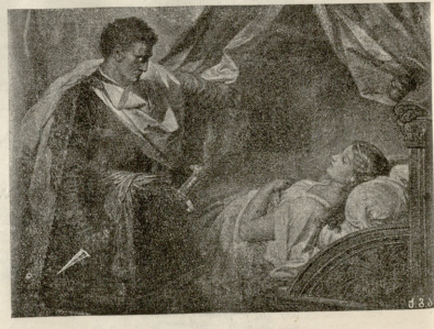
ოტლოდ დეზდემონას მოკვლის წინ. სურათი გოგმანისა.

„ჯაშუსი ხომ არ არის?“ გაიფიქრა უცებ გულში საშოკომ, მაგ- რამ ჩქარა შეიცვალა ხარი: „არა, პრეინციულ წიგნების გამყიდვე- ლების უტარავლესობა თითქმის პროგრესული ნაწილს შეადგენს ჩვენ სახოვადებისას. არა, ამას უფოოდ შევეკითხები, ვის მიგზავრო“.