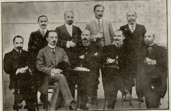
წ.-კ. გამყარველ. საზოგადოების ბაქოს განყოფილების გამგეობა.

— მერე, მე საცოდავო, მე რა გიშველი? — სიტყვა მღვდელმა. — შენ ეშვები მოგჩვენებია სიცოცხლის ჩასაწვარებლად. — აბა კიდევ შენ უნდა მასწავლო, მამაო, წამალო, ხელი როგორმე ჩაეკლო იმ ეშვას და მერე რამდენიც უნდა ეწვალოს, გაიწიოს საითაც უნდა, თუნდა კლდეზე გადაეხრის, თუნდა წყალში დაახრის. ნეტავი ასე მოხდება, ნეტავი იმის ხელით მეტირის სიკვდილი. — ეგ, შვილო, მე არ ძალ-შიძი, ევედრე უფალსა, რათა სძლიო შემაწუხებელი შენი. — მიუგო მღვდელმა და გასწია თავის გზაზე. დარჩა მარტოკა მონადირე. ედრება უფლისა იმისთვის ახალი ამბავი არ იყო, უმჯობესად ბეგის ეგვეწვება და ემუდარებოდა ღმერთს ეშველა რამ მისთვის; შველა თუმცა არ სჩანდა, მაგრამ მაინც ისევ დღისი ევერება მიარდა მას წაშლად. იქ ევედრა ის ცოტა ეგონა, ამიტომ მონადირემ ლოცვა-ვედრება გათავისუფლა და განა მარტო ღმერთ ეგვეწვება — ეველა ხატი, ეველა სალოცავი. მონადირე მხად იყო ენებასთვის კი სულ მიუცო ოღონდაც თავისი წადილი აქსრულდებოდა. მიზნისთვის მიეწეო.