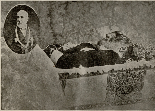
დიმიტრი ხოტიანი. (დაბადებიდან 100 წლის შესრულების გამო).