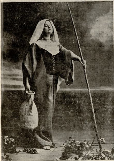
უ ს ი ნ ა თ ლ ო.