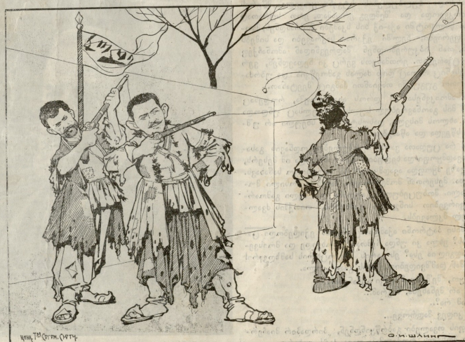
გამოტვირთული თავადების „პაპატიოული“ სამაინრობა.