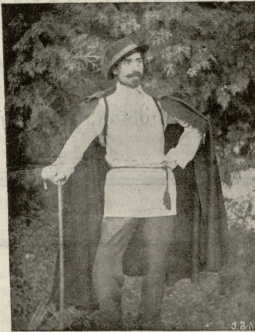
არ, ევლავილი სოხუში. (გამობრუნების გამო).