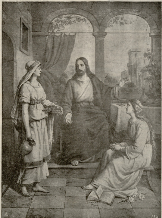
ქრისტე, მართა და მარიამი. ნახატი ე. ჯაფარიძისა.