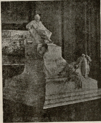
ტრასა შეგენქოს ძეგლის პროექტი მოწარმებელი.