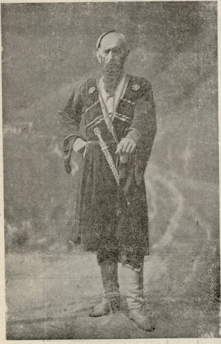
ოტი ჯოლი (აღა-შა, ვ. გუნისი)