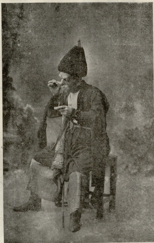
გიქოშ (აბოლა, გ. სუნღუკიან(კისა)