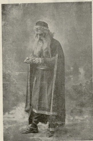
შეილოხა (აგნეციელი ვაჟარი, უ. შექვაბერიანი)