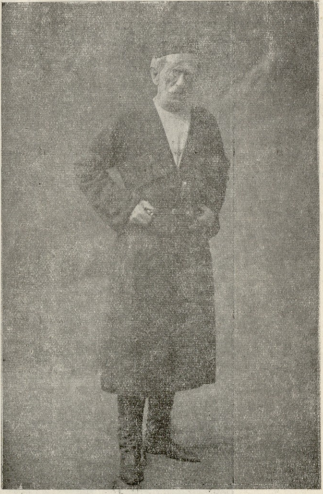
ანანია (ელაოტი, სუმბათაშვილისა)