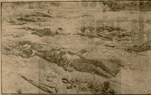
სანიტარებს გაქვავთ დაქრილები ბრძოლის ველიდან

არ იყავი: ეს ყრფ, მუნჯი, სუფელი ბრძო, როგორის ხალსით, ს-სასტკით სტვენდა, რა აღუტოვანებით ისმენდა ჩემს გინებას... შალვას... შალვას სიტყვებს.