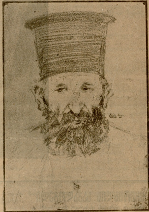
ერსიზნანის ტაძარი. ბერძნის მღვდელი. ნახ. მ. მუსავეხია.

ხე-ახის ხმა. ვაშა გიორგის! გავმარჯოს გიორგის!