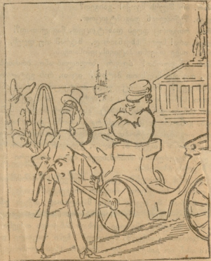
სახერმენის ნეტრალიტები. — მეტრევე: ბულგარეთისკენ — არა მკლავან, დაკეხული ვარ...