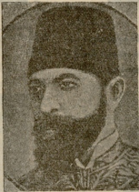
კასთი-ოსმალეთის მიმ. ირეკ-ფაშა, რუსეთის საზღვრებზე მომხმედ იმსალეთის ჯარის მთავარ-სარდალი.

ხოლმე. გვანა დაქმინდა, თუმცა ძალიან დალოლო-დაჩქარებოდა ვიყავე, ახლად იმისთვის, რომ ხანი ადგილი იყო, ტახტოც კი ერთობ ქრალობდა. ძლიეს ვიყავე. რაღაცა ხენვეს მომიხმობდა და ხანმოხანო მუქ ხეობი იქ მეტყობა, მაყვალუნდა ეს ხმა, მაყვანება, მაგრამ ვერა ვაპოვრეულყოფე ძილდნენ. სეზარ ამ უსწაური ხებებიც აღვიდნა ამ ხმას, კაცისა თუ ცხოველ-შფირენილის ხებები. ამ გამოურევიყო ხანპრობას უტყრად დავითო საწილოდ ღმერთი და თვალზე დაძანხა. წამოვფინდი, ვავალე ფანჯრის დარბაზ; ხარი იდგა და ჩემ ფანჯარასთან და შემომიძლიდა. იქვე ხრუტუნებდა ღლიო და ქერისის ვურჯას აბტერგებდა; ისე ემზანადა აქნაფუნებდა და ლოკოკალი, თითოუ მოხალხებ სულ შეეკეტებოდა. გამორეკობი ქათამი, ინდლარი, ბატო, იხეო, ტრეწმე-ტრეწმე ბაღლები. დასტამოვიეთ ამისარსული დღდაკაცი მისჯილობად ძირბას და კოტუხანი თითქმინ ჩიქას ჰურებად მწყობინარი მუქებიდან. ჩემი ოთახის ფანჯარა თორემ მეორე ებს დაჭყურებდა მთლად აქვეყნებდა და მოთხოვნი მინჯავდა. წუ თუ სოფლად ამ ნაყალა არ არეკობს, ან ექნება, ან სხვა ვინმე ყრისმავლებო, რომ თვლი ადვილს აჭკობრებას! მეტლად გილოდა, ცივი ხნი უფარავდა, ქრუსტლებად დანთარა ტანში. იქნება იმ ღამეს და ნესტის სუნე იცავ. ისევე ჩავწყენ. შამფურივით გზოუფინდი ლღობინ, ვივარ დაძმინდა და ვეღარ.