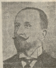
მარკიზ დი-სენ-გუსტინი, იტალიის გარეშე საქმეთა მინისტრი (ამ დღემდე გარდაიცვალა).