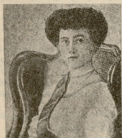
ლიუქსემბურგის დიდი ჰერცოგინია, მარინა-აღუღანიძე; (გერმანელებმა მისი საქართვეო დაიპყრეს).