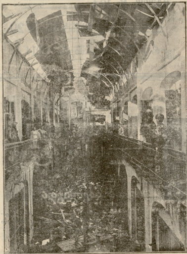
მარცხენა მხარის ღერუფანი თვ. აზნაურობის ქარვას- ლაში სადაც წერა-კითხვის საზოგადოების ორი საწყოში ხულ დაწვა.