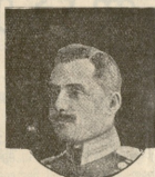
ფლიგ.-ადიუტ. თავ. ბ. ნ. იანსთანი (დაჭრილია).