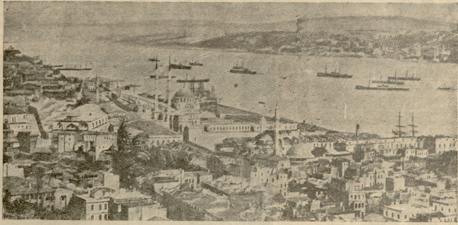
ბათუმელი და გოსუმლის სუბთ.

ღით გვედგას, ვერც მაშინ გავაწყობთ რამეს... ეს საერთო საქმეა. ოღიში მართკ ვერ იქსრებს ამ საქმის ასე თუ ისე გადაწყვეტას... აჰა, ჩვენც გზორბეც მობრანა... ისე მალ-მალ ხელებიან უკან, აღბად ახლავა ჯარისკ.