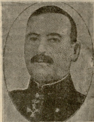
მამრანელი გენერალი გ. ს. სამადაშვილი, ოსმალეთის სამხარ სამზადისის ხელმძღვანელი.

შე კარგა მალაზზე ასულიყო და დედოფალან მისვლას ჯერ კიდევ ვერაფერ ბედავდა. მას წინდაწინვე ნაბნებნი ჰქონდა სახლთუბუცესისთვის, რომ არავის მიიღებდა და ერთფული მოხედეც, ის იყო, შორი-ახლოდან დარაჯობდა თავის სთაყეანო კერას. ის იჯდა ცოტად მოღებულ კართან, საიდანაც დედოფლისგან შეუნიშნავი, თითონ ნათლად ჰედავდა დედოფალს; ხედავდა, როგორ იტანებოდა ის, როგორ ჰკარგავდა სასოებას, როგორ ეფერებოდა შვიი ღრუბელი მის ბრწყინვალე სახეს და იმის ტანჯვით იტანებოდა თითონაც, მაგრამ რა ენა? ვხა ხსნისა ყოველგან შეტრლი იყო... სახლთუბუცესმა მხოლოდ მაშინ გაბედა გამოცხადებოდა დედოფალს, როცა რუსის ჯარის მოახლოების ნიშანი თვალწინ დაეხატა.