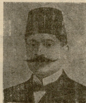
ოსმალეთის მოღვაწე ბალაბთ-ბი, შინაგან საქმეთა მინისტრი.

— ეს ნიშანი ჯარის მოახლოებას უნდა ნიშნავდეს, შვეზე უბრწყინვალესო დედოფალი, — მოახსენა მდებლად ცალმუხზე დაჩოქილმა სახლთუბუცესმა და მიუთითა მტვერის სვეტზე, რომელიც ღრუბელივით ადიოდა ცაზე.