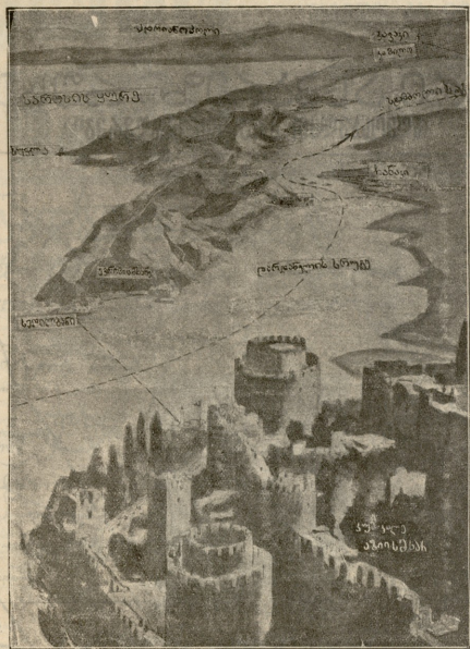
დარდანოს სრუბი სიზმრებით.