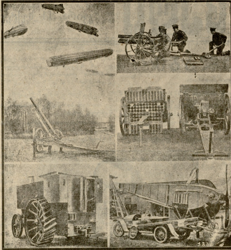
1) საფრენების წინააღმდეგ საბრძოლველი ზარბაზანი. 2) 7,6 სანტიმეტრიანი სწრაფ ხასროლი ზარბაზანი. 3) სწრაფ ხასროლი საველე ზარბაზანი 7,6 სანტიმეტრიანი და მისი ყუმბარების ყუთი. 4) ჯავშნიანი ავტომობილი დაეცოლ ჰაეროქლანების გადასაზღო.

მო ოღიშინიდან ჩამოვა აქ ლაშქარი და საჟილოაში ქვაზე ქვა არ დარჩება!.. რას ფიქრობდით, როცა ამ სამარცხენო ტახტს უწნავდით ამ არა წმინდას?! ან ეს უფროსი მთავარი რატომ სირცხვილით არ დიფენა მაშინ, როცა ის თქვენს კისერზე ავიდა?! განა იმისთვის უნდა აჯანყდეს და აირ-დაირიოს ხალხი, განა ამისთვის უნდა აობრდეს მთელი ოღიში, ან განა ის არის დღეს ხალხის აზრი, რომ ერთი ბატონი ჩამოავდოს ტახტიდან და მეორე დასვას?! რას იტყვით ამანზე? კიდევ დასცვით თავზე ამ უგუნურს!..