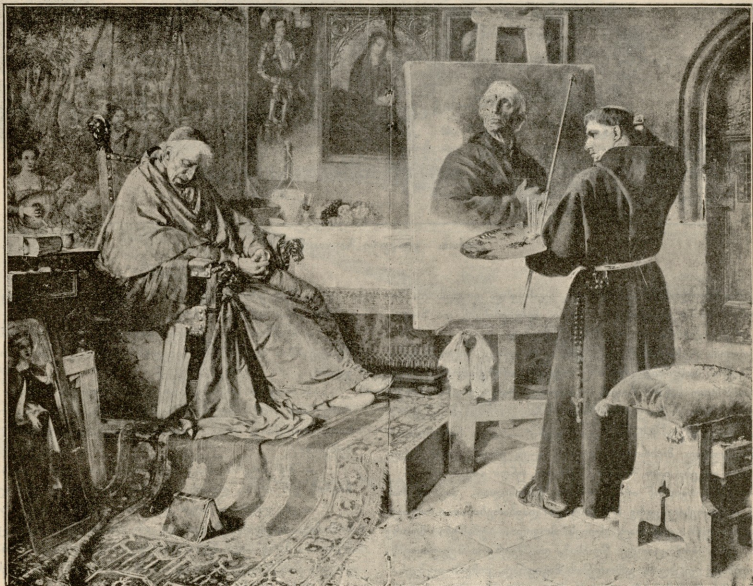
გაკვირებელი მღვდამბრძოლა მხატვრისა კარლინალის სურათის ხატვის დროს.—სურ. როზენტალისა.