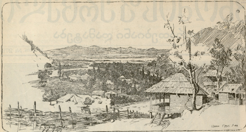
გურია. — ვაკეჯვარი მადლიან.

ში, გადაიქმუილებდა სერებისკენ, აჯანყებდა თოვლს და მიჰქონდა ზოგი დღეებისკენ, ზოგი სახლებისკენ და ზოგიც ბილიკების ოღრაწოდროს შესაკეთებლად.