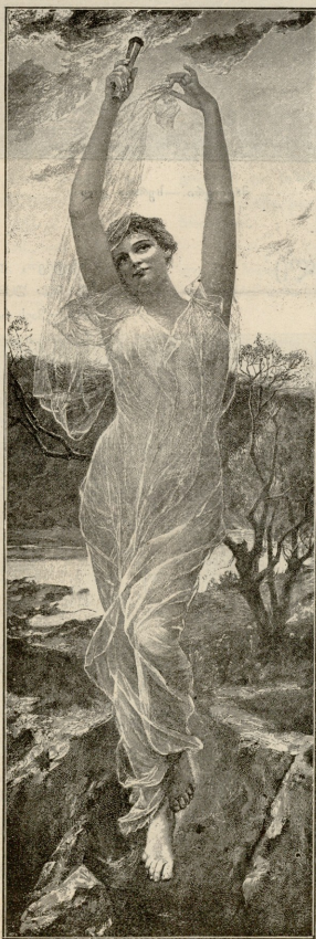
ცინკარა სურათი ზვიტერდისა.

დილის ნაივი განთიადს მწარე ცრემლებით სტაროდა, ღრუბლებში ჩისრებულსა მზეს ნაბერკლები სცვიოდა.