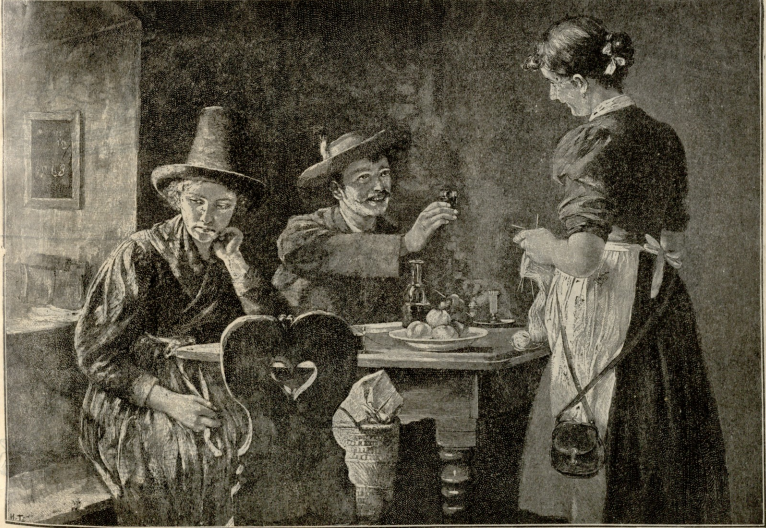
ეკვანია ქალი.—სურათი მუღღერასი.

— აბა, წყალი მავათ!—დაიღრიალა აკომ დანილირმა.