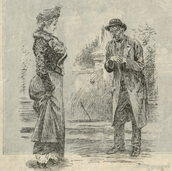
ახალი წინადადება ზემარ სიტყვაობის შესყურებად.