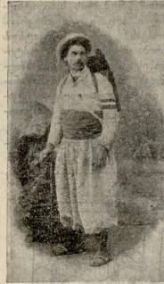
ემილ კაპლნი ღვამაშის გარშემა ღვბით მოგზაურო ფრანვი.

შროშნება დეკანოზის ბალსაც დაანებეს თავი დი ხშირ ღრუბელსავით გასწრეს ზეცის სილამისსენ, მაგრამ პირეშიინ-