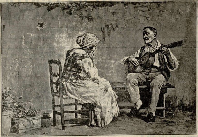
სახვგაწდაბას მოგანება.—ურთა ვაღუბსი.