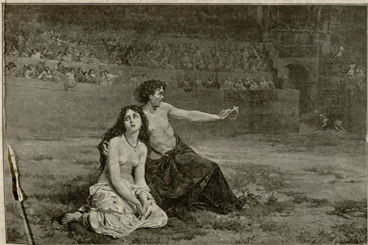
ქრისტანეთი რომის ცირკში. — სურათი მანტეგასის.

გაცხარებულმა დავიწყე მტკიცება, რომ იმისი განზრახვა უზნეობა იყო. ის უბრალოდ მიძლევდა პასუხს, მებუნებოდა,