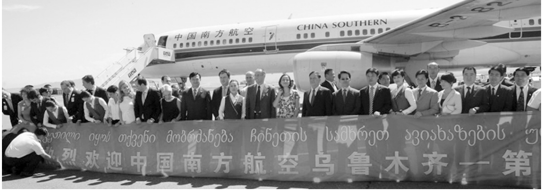
ქართული იყოს თქვენი მომხმარებელი ჩინეთის სამხრეთ ავიახაზების უმჯობესი მომსახურებელი

ამის ფონზე რუსეთის წარმომადგენლობა მეტისმეტად მცირეა. იაპონიიდან მხოლოდ ერთი ადამიანი მონაწილეობს ფორუმში. არ არის გამორიცხული, რომ უახლოეს მომავალში საქართველოსთან კავშირები ჩინეთსა და ამერიკის შე-