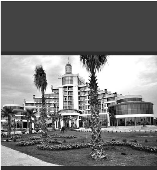
„სამეგრელო იყო ერთი და ერთი იმ სეკულისა, რომელსაც საქართველო ერდებოდა. ასე იყო წიგნი, ეგრე არის ახლა და ეგრე დარჩება მომავალშიც.“ (ილია)