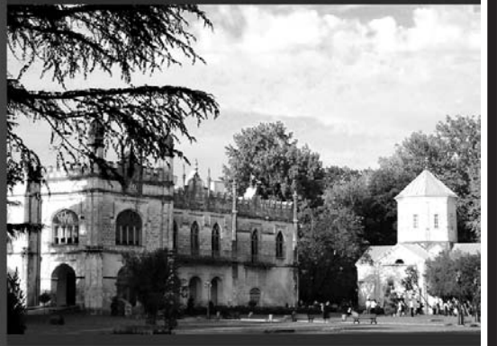
წარსული და თანამედროვეობა