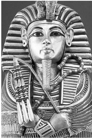
ბარბრძღვება, დასახვისნი ნბ. „საერთო გზაჯი“ №8-23