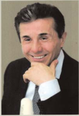
მე, ბიძინა ივანიშვილი მეცენატის პორტრეტი

გამომცემლობა „მერიდიანმა“ გამოსცა მცირეფორმიანი წიგნი „მე, ბიძინა ივანიშვილი“ — მეცენატის პორტრეტი. წიგნის გამომცემელია ოთარ კუ-