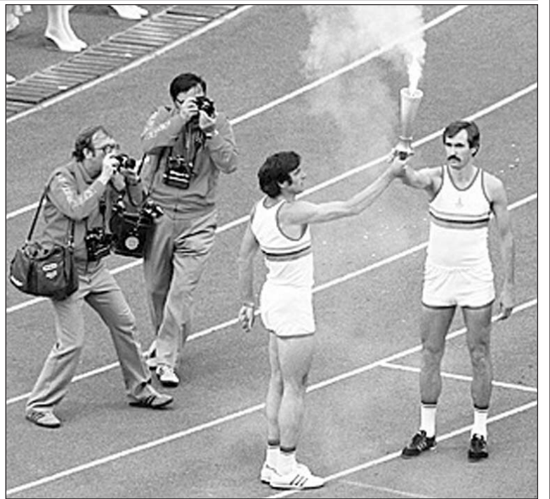
ლის ოლიმპიადაში წარმატების მისაღწევად“.

„კრემლში ორდენის გადმოცემისას პირობა დავდე, რომ ყველაფერს გავაკეთებდი მონრეა-